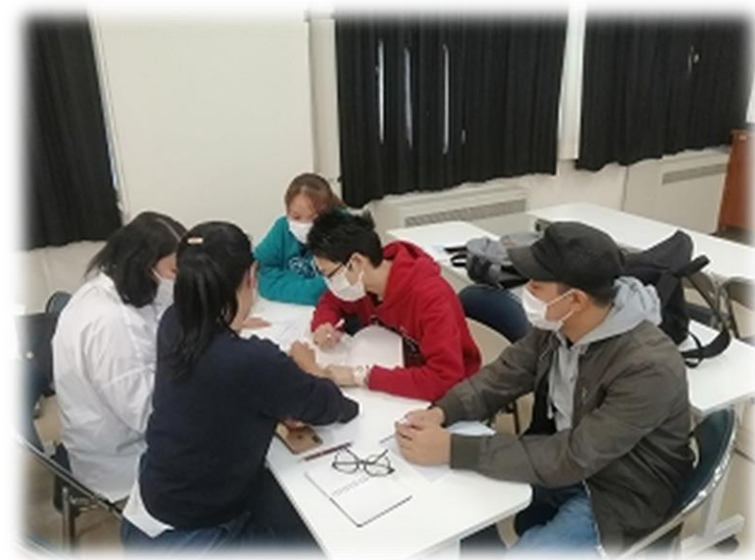
資格試験サポートをするコーディネーター